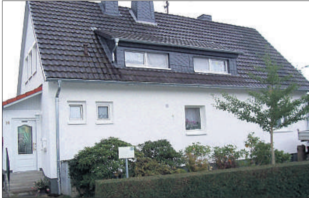
EiMSIGartige Vorteile für Haus- und Wohnungseigentümer: Technologie, die mitdenkt, sorgt in diesem modernisierten Einfamilienhaus für wärmere Zeiten. So ist mit Sicherheit etwas für Geldbeutel und Umwelt getan.

Mit der Schaffung eines Kompetenzzentrums rund um die Immobilie, will der Unternehmer gemeinsam mit seinen regionalen Kooperationspartnern aus allen Baugewerken neue Wege beschreiten. Von einzelnen Bauelementen über die Modernisierung ein-